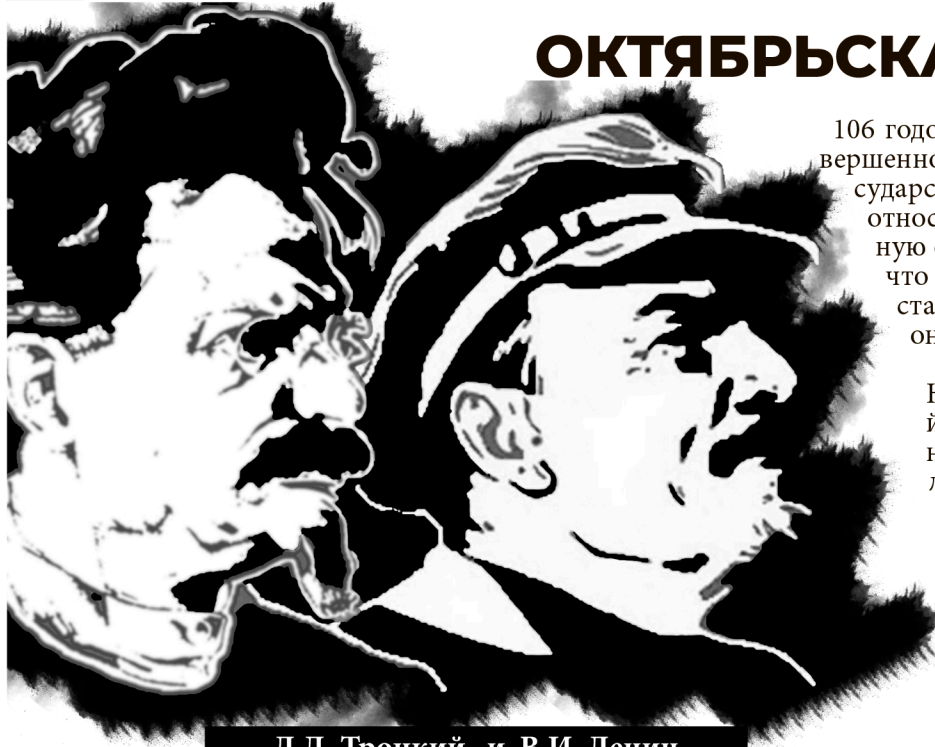
Л.Д. Троцкий и В.И. Ленин

106 годовщина Октябрьской революции прошла совершенно незамеченной со стороны российских государственных СМИ, которые всегда с презрением относились к нашей рабочей революции. Особенную остроту это молчание приобретает и потому, что сегодня мы живём в эпоху, когда все ужасы старого мира, когда-то сокрушённые революционерами, вновь возвращаются в нашу жизнь.